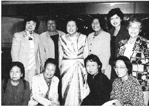
36年卒の生徒さん達と

「ト」と題して、趣味のポピュラーヴォーカルのリサイタルを開きました。時は五月十一日、所は芝公園のabc会館ホールで。その折、担任クラスだけでなく、同学年の皆さんも多数来て下さいました。有難う御座いました。拙いパフォーマンスでしたが、皆さんから見ると恐らく倍も年上に見える倍もが、ストーリー仕立てで22曲もソロ歌唱した事に感心されたようで、口々に「力付けられました」と言っていました。