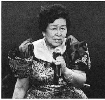
舞台上の種子先生

面白い話を聞きました。私が三田高校を辞めて二十数年経った頃のこと。それに先だって、担任クラスの数人が集まった時、ずっと私に会ってなかった一人が、「私達が在学時18歳の時36歳だった先生は、私達が40歳になった今、倍の80歳になられたのね」と言い出し、暫し私の年齢のことで話が賑わった。それを聞いた時、「お願い！そんなに早く老い込ませないで頂戴。第一、私は80歳迄なんて生きられそうもないのに」と思ったものですが、やっと今年、無事、皆さん御期待の80歳になりました。